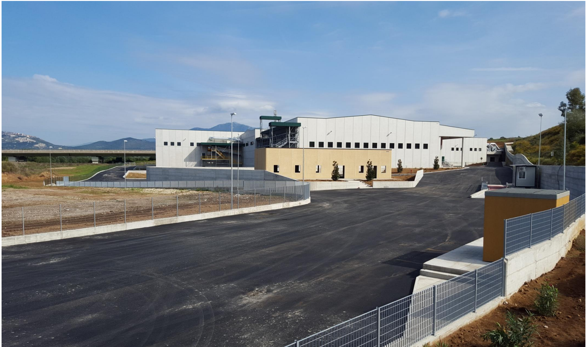
IMPIANTO TMB PRONTO PER ENTRARE IN ESERCIZIO (autorizzato con AIA n. C1869 del 2/8/2010)