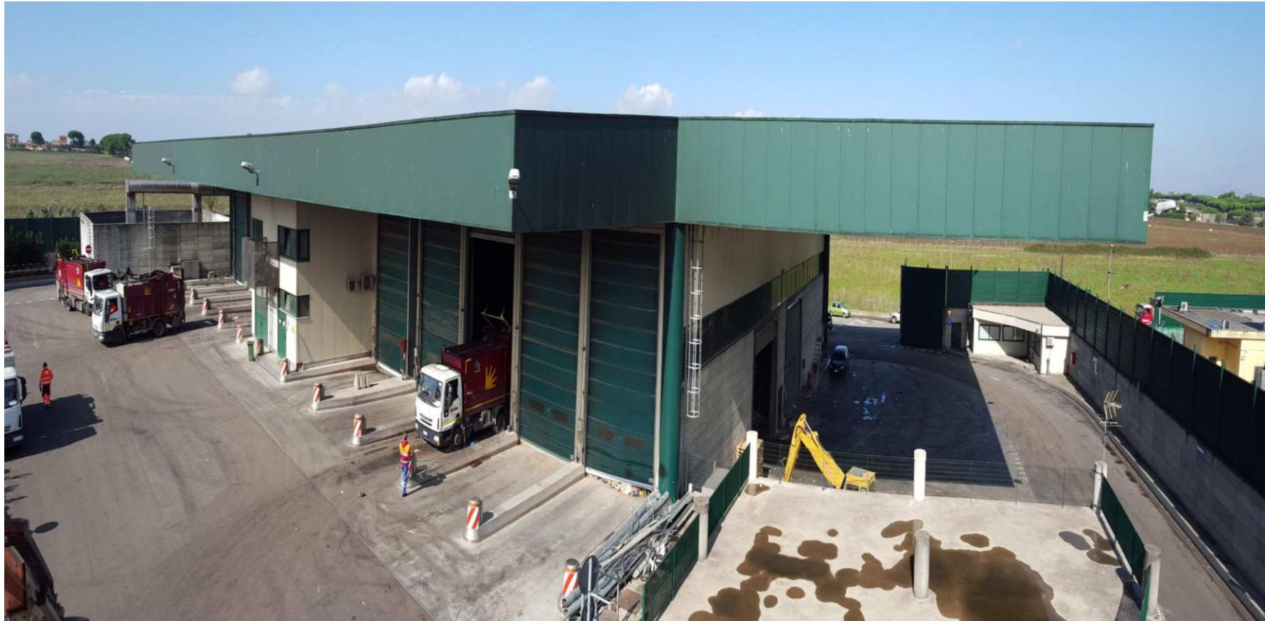
TRITOVAGLIATURA - COLARI (Rocca Cencia)