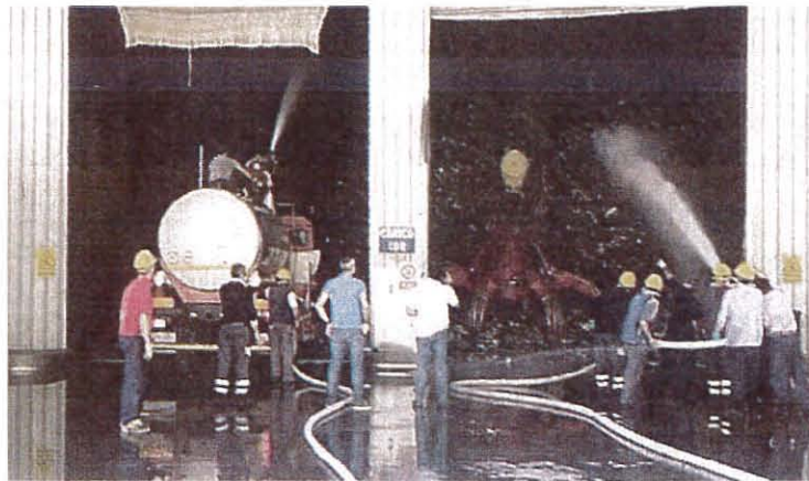
I vigili impegnati nello spegnimento dell'incendio a Malagrotta

L'incendio ha interessato un deposito di cdr, il combustibile da rifiuti destinato agli inceneritori. Non si è prodotta una nube nera come a Pomezia, ma l'odore del materiale bruciato si è diffuso nella zona. Il rogo è stato spento, anche con l'intervento dei vigili del fuoco (tre squadre e il supporto del Nucleo batteriologico e del carro autoprotettori), in un paio d'ore. I danni sono stati limitati al capannone. I vigili del fuoco sono rimasti a Malagrotta tutta la notte per monitorare eventuali nuovi focolai. Ci sono due risvolti da non sottovalutare. Il primo: se l'incendio avesse